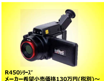
R450シリーズ メーカー希望小売価格130万円(税別)～