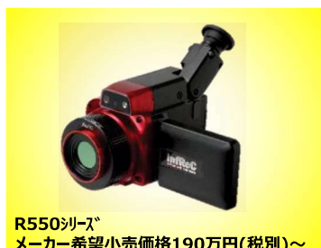
R550シリーズ メーカー希望小売価格190万円(税別)～