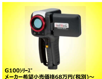
G100シリーズ メーカー希望小売価格68万円(税別)～