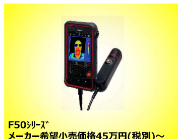
F50シリーズ メーカー希望小売価格45万円(税別)～

※Avioのサーモグラフィなら、体表温スクリーニングの他に 電気設備などの診断 や、熱にかかわる 研究開発 にも ご利用いただけます。